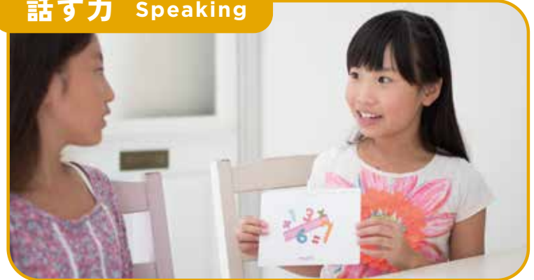
先生と、お友だちとたっぷり英語でやりとり。少人数制だから密なコミュニケーションがとれます。