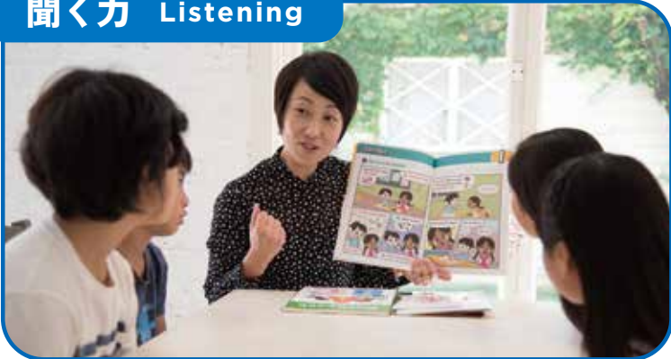
わくわくするストーリーに夢中で英語を聞きとっていきます。