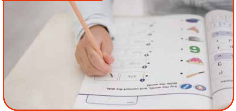
レッスンで、ご自宅で、英語を書く力を養うワークに取り組んでいきます。