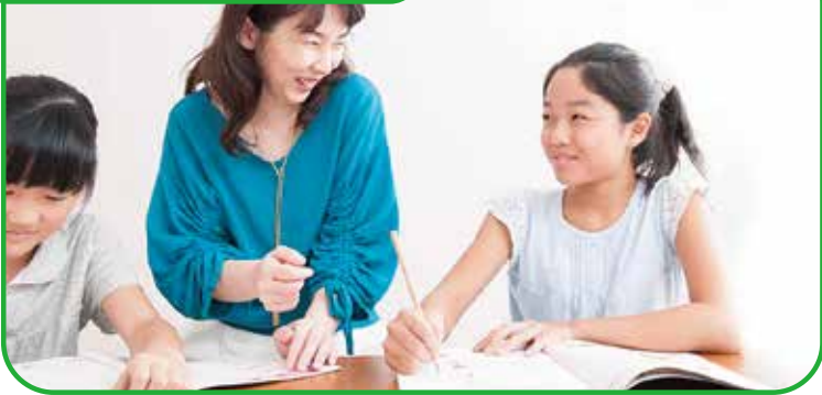
アルファベットに親しみながら、文字と音のつながりを意識して読む力を育てていきます。